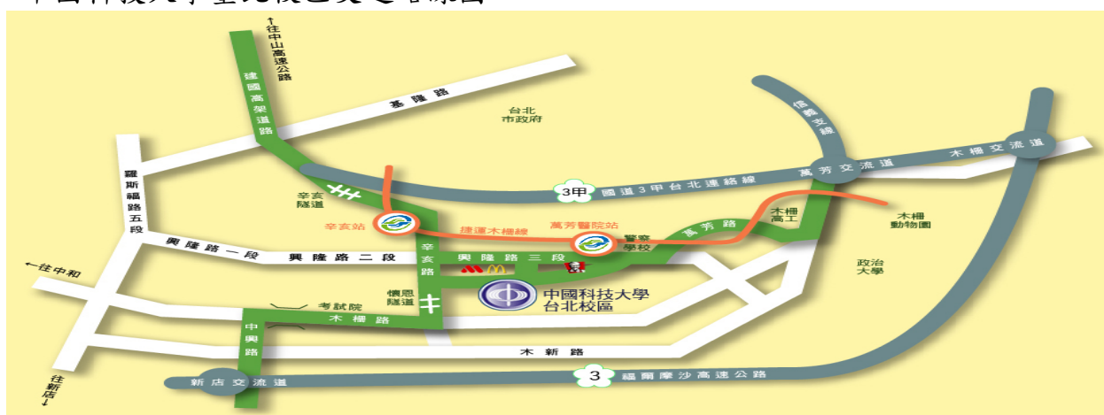
中國科技大學臺北校區交通路線圖